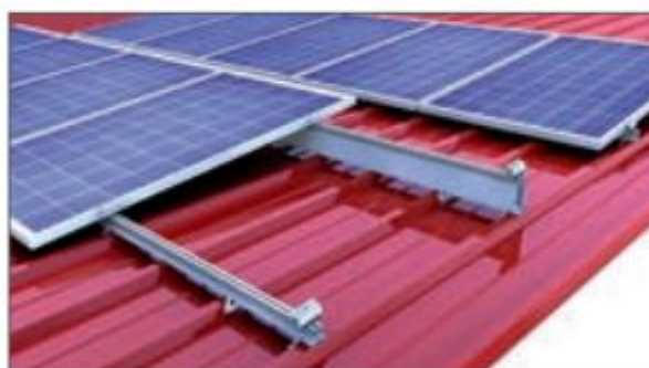
Klemmsystem: Hochkantmontage aufgeständert Direktbefestigung