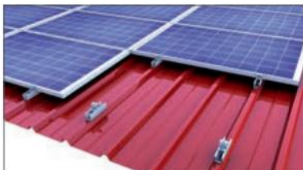
Klemmsystem: Quermontage Direktbefestigung