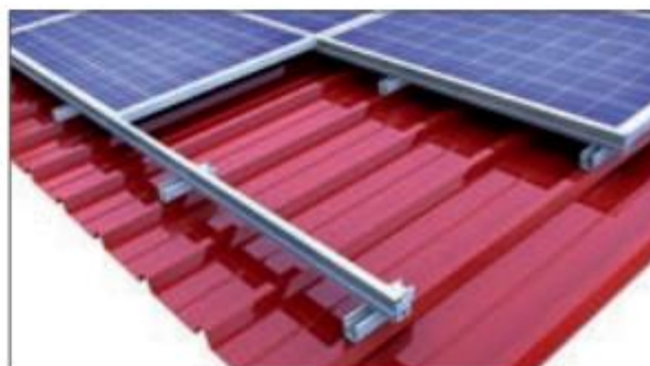
Einlegesystem: Quermontage auf Kurzprofil Direktbefestigung