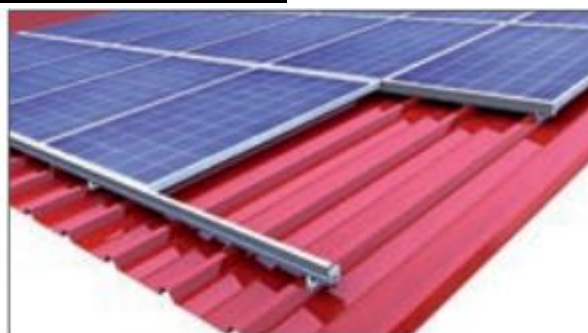
Einlegesystem: Hochkantmontage Direktbefestigung