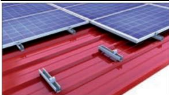
Klemmsystem: Hochkantmontage Direktbefestigung Kurzprofil